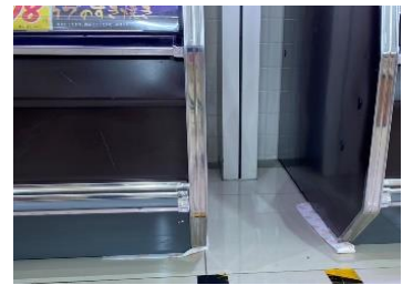
タイプ：A B - 5 5 0