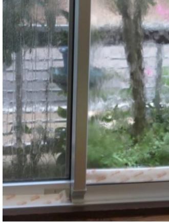
タイプ：A B - 5 5 0

3月の集中豪雨発生時、結露が発生。同時に吹込み雨水が窓のレール溝に溜まりました。吸水テープ：A B - 5 5 0は550g以上吸水し、乾燥・吸水を繰り返します。